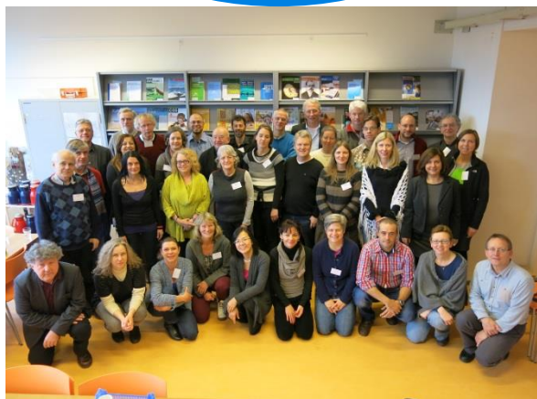
Het PARRISE consortium